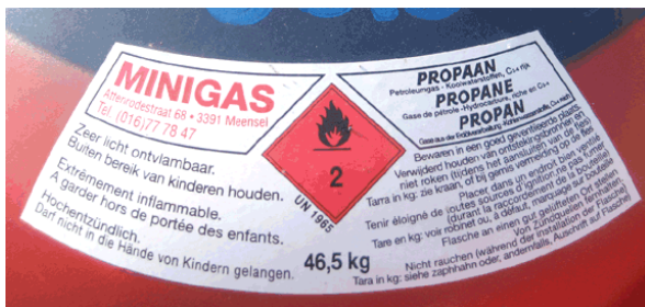
Autocollant "MiniGas" sur la bouteille